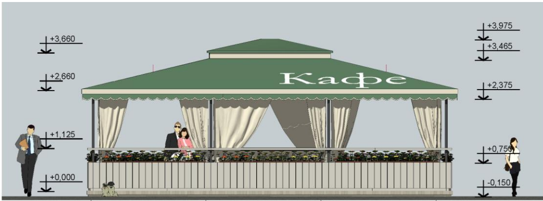
Фасад в осях 1-4