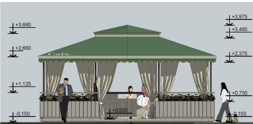
Фасад в осях Г-А